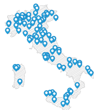
Distribuzione geografica dei Soci IMI

L'anticipazione della cura impone la gestione multidisciplinare del paziente con melanoma ed applicazione di un percorso diagnostico, terapeutico ed assistenziale (cosiddetto PDTA) idoneo allo specifico stadio di malattia di ogni singolo paziente, in modo da garantire l'attinenza alle linee guida ufficiali per la diagnosi e cura della malattia. La gestione multidisciplinare è oggi estesa anche ai tumori cutanei non-melanoma (carcinoma squamocellulare o basocellulare) in fase di malattia localmente avanzata o metastatica.